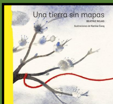
Una tierra sin mapas