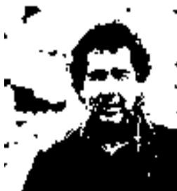
HERNÁN RIVERA LETELIER

Nació en Talca (1950). Vivió hasta los 11 años en la oficina salitrera Algorta. Tras su cierre, la familia se traslada a Antofagasta, donde muere su madre. El se queda en Antofagasta hasta los 11 años aproximadamente. Para sobrevivir, vende diarios, trabaja como mensajero y, ya a los 18 años, entró a un taller eléctrico y comienza a escribir. Su afán aventurero lo lleva a recorrer a dedo, por tres años, Chile, Bolivia, Perú, Ecuador y Argentina. Tras regresar en 1973 a Antofagasta, se casa. Pronto parte a Pedro de Valdivia, otra oficina salitrera. Estudió en la escuela nocturna séptimo y octavo año y obtuvo su licencia de enseñanza media en Inacap. Su más célebre novela, La Reina Isabel cantaba rancheras , lo catapultó a la fama en 1994.